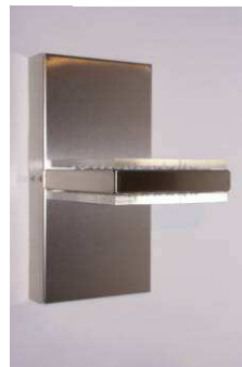
Muro D2 ↓